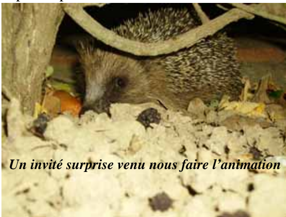
Un invité surprise venu nous faire l'animation